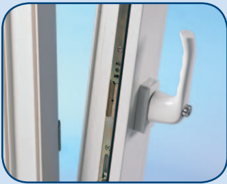
afsluitbaar raamkrukje SKG** / PkVW