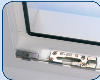
inbraakwerende rol- en paddestoelnokken SKG**