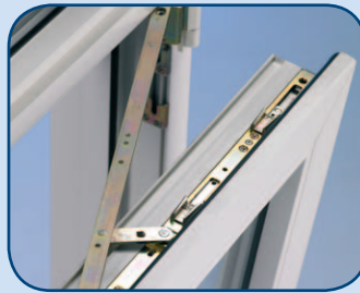
kiepstand (160 mm ventilatiestand)